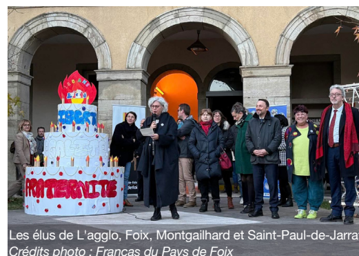
Les élus de L'agglo, Foix, Montgailhard et Saint-Paul-de-Jarrat

Montgailhard et Saint-Paul-de-Jarrat ont offert un spectacle illustrant les valeurs de liberté, respect et égalité. Orné de 120 bougies, le gâteau d'anniversaire en papier mâché, fruit de leur travail, a été le symbole de cette journée. Une exposition itinérante et une « talk box » mobile ont complété le dispositif, permettant à chacun de s'approprier l'histoire et les enjeux de la laïcité. Par son engagement, L'agglo a souhaité faire de cet anniversaire bien plus qu'une date et rappeler l'importance, chaque jour, de mettre en œuvre et faire respecter le principe de laïcité.